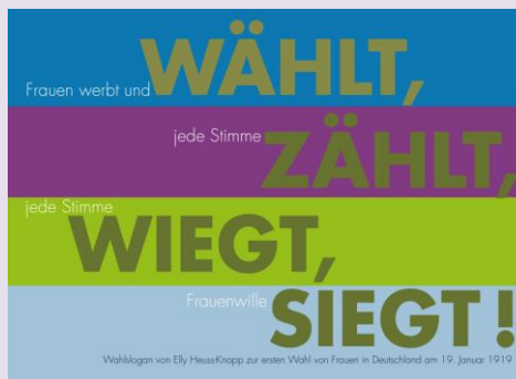
Bild: Postkartenkampagne des Landesfrauenrats Sachsen-Anhalt

Dennoch sind Frauen gemessen an ihrem Anteil an der Bevölkerung nach wie vor unterrepräsentiert: Das gilt besonders für die kommunale Ebene. Hier beläuft sich ihr Anteil häufig nicht einmal auf 30 Prozent.